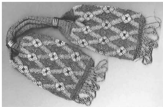
Geldkatze mit eingehäkeltten Perlen, 19. Jh., Weißenburg