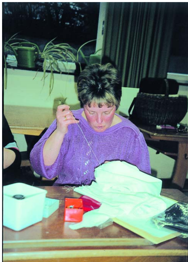
Trachtennähkurs in Mäbenberg, 1994.

Aus dem Zusammenspiel von kulturbedingter inhaltlicher Zeichenhaftigkeit und zeitabhängiger Erscheinungsform erklärt sich „Tracht“, was am Beispiel der mittelfränkischen Tracht aus dem ländlichen Raum um Weißenburg verdeut-