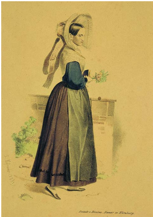
Evangelische Abendmahltracht; Trachtendarstellung aus Rothenburg, 1858, kolorierte Lithographie von Ludwig Schamer.

Der Versuch und das Bedürfnis einer Auseinandersetzung mit dem Berufsbild des Trachtenforschers und -beraters lässt den geneigten Leser schon meine derzeitigen selbstkritischen Zweifel erahnen. Das anstehende 10-jährige Jubiläum des Gredinger Trachtenmarktes gibt Anlass, wieder einmal die durch die öffentliche Hand finanzierte Trachtenpflege in ihren Inhalten, Zielen und Darstellungsformen auf ihre Vertretbarkeit und Effizienz bis hin zu ihrer Existenzberechtigung zu überprüfen. Ist sie noch auf dem richtigen Weg oder hat sie eine falsche Richtung eingeschlagen? Muss sie wieder einmal auf den Punkt gebracht und von allzu viel Heimattümelei, Eigendynamik und Selbstdarstellung „entmüllt“ werden? Was ist unser Auftrag im Dienst und unter Finanzierung der öffentlichen Hand und darüber hinaus unsere menschliche Sendung für das kulturelle Erbe?