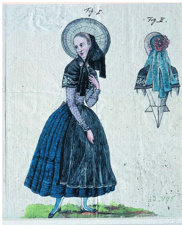
Evangelische Abendmahlstracht um 1840, die in der typischen Modensilhouette der Zeit, jedoch mit regionalen Details gezeichnet ist. Dieses Aquarell diente als Vorlage für die Hochzeitstracht einer Mittelfränkinn aus dem Raum Weissenburg, die anlässlich der Hochzeit des Kronprinzen Maximilian mit der preußischen Prinzessin Marie zusammen mit weiteren 35 Paaren aus Bayern in ihrer Tracht in München heirateten durfte.

Kleidung zum Grillabend, bei Nähkursen und vielen Gelegenheiten mehr.