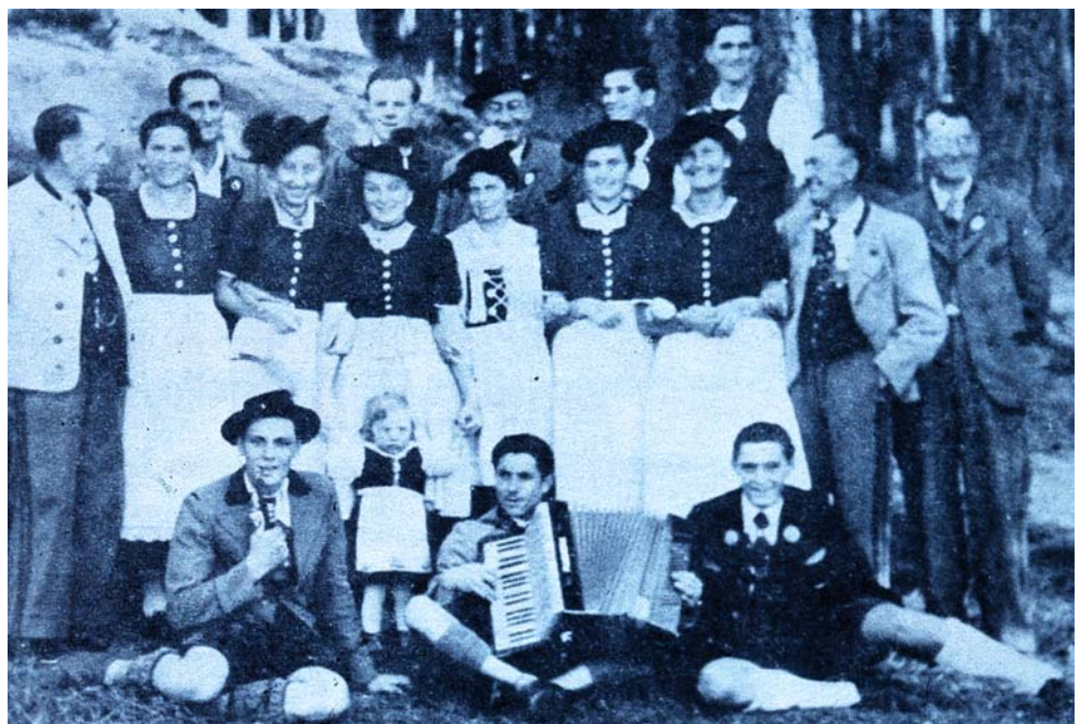
Volks- und Gebirgstrachtenverein Moorenbrunn (bei Nürnberg) in den ersten Jahren nach der Gründung 1946.

Da wir in dem Kapitel „Brauchen wir heute Tracht“ zu einem positiven Ergebnis gelangt sind, müssen wir sie auch pflegen. Den Trachtenpfleger begreife ich jedoch nicht als Krankenpfleger in einem Sterbehospiz, sondern vielmehr als einen Übersetzer der Trachtensprache. Voraussetzung für die Trachtenpflege ist die Erforschung des historischen Kleidungsverhaltens in den einzelnen Regionen, mit deren Ergebnissen die kulturellen Rahmenbedingungen anhand der herausgefilterten charakteristischen Elemente gesteckt werden können. Sie bilden die Basis für eine zeitgemäße Weiterentwicklung, die sich attraktiv in unser heutiges Modebild