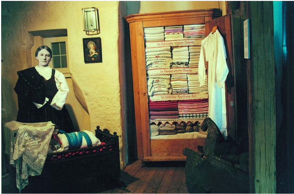
Ausstellung der Trachtenforschungs- und -beratungsstelle des Bezirks Mittelfranken in Schwabach, 2001. Das regionale Kleidungsverhalten wird im Lebenslauf und Jahreskreis dargestellt.

einordnet, aber noch eine regionale kulturelle Identitätsfindung zulässt und nicht von vornherein durch jegliche Aufweichung dieser entgegenarbeitet. Dazu bedarf es keines Modeschöpfers, aber der Empfindsamkeit und des Stilempfindens eines solchen. Meiner Meinung