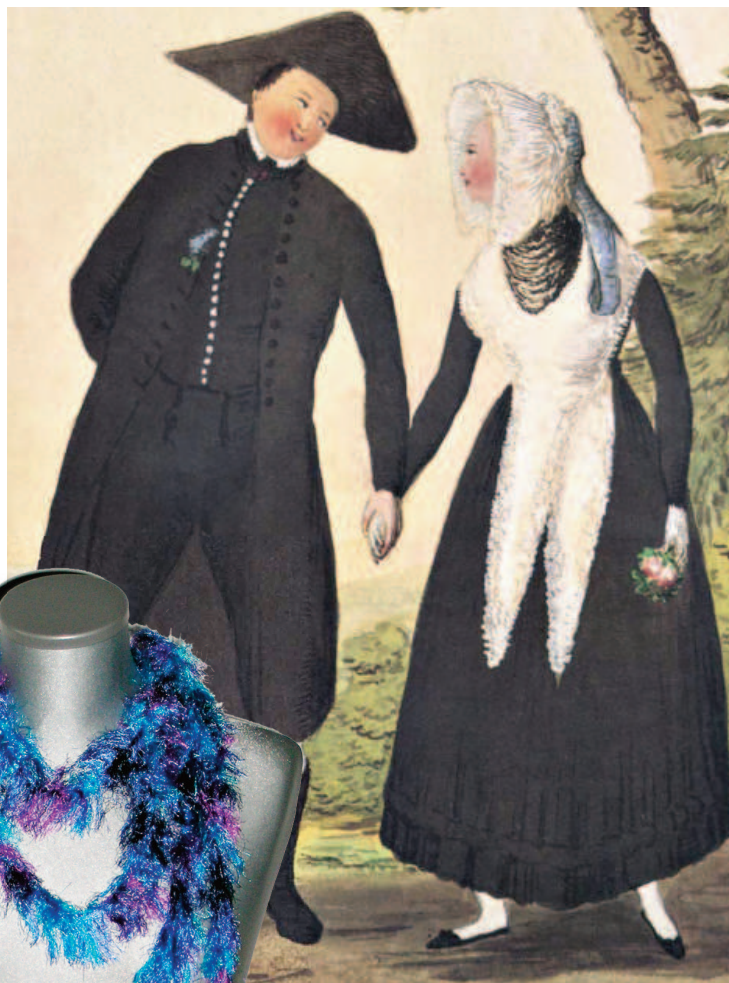
Abb.oben: Ländliche Trachten aus dem Raum Bad Windsheim; Die Frau trägt als Halsschmuck einen „Halsbuttel“. (Mittelfränkische Volkstrachten Nr. 31, Stadtarchiv Ansbach)

Abb. links: Mit der Strickgabel aus Effektgarn gefertigter „Halsbuttel“ als Modeschmuck; der „Halsbuttel“ in schwarzem Garn gestrickgabelt kann auch zur erneuerten Tracht angelegt werden.