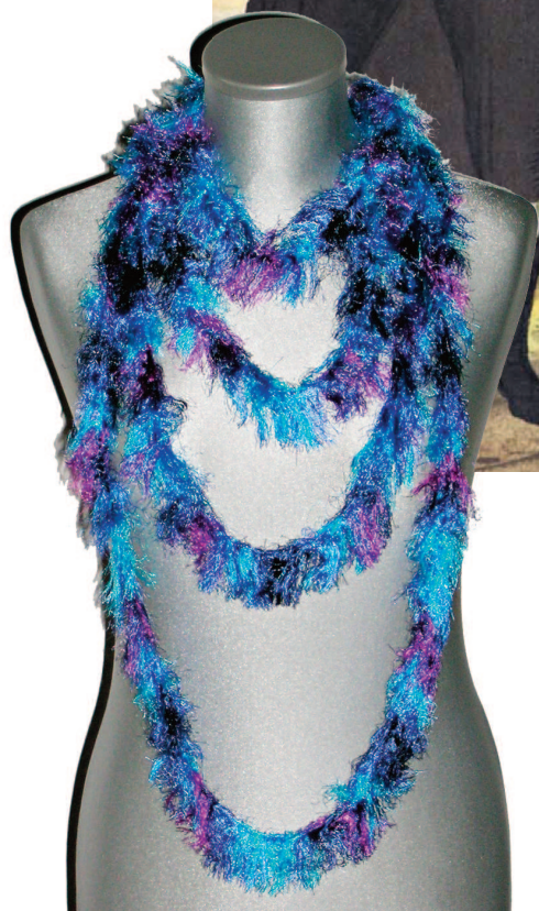
Abb. links: Mit der Strickgabel aus Effektgarn gefertigter „Halsbuttel“ als Modeschmuck; der „Halsbuttel“ in schwarzem Garn gestrickgabelt kann auch zur erneuerten Tracht angelegt werden.

Abb.oben: Ländliche Trachten aus dem Raum Bad Windsheim; Die Frau trägt als Halsschmuck einen „Halsbuttel“. (Mittelfränkische Volkstrachten Nr. 31, Stadtarchiv Ansbach)